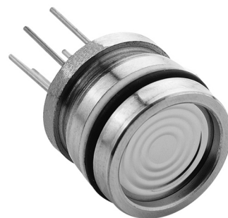
Series 8 High Pressure