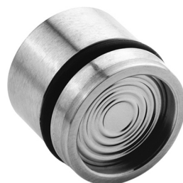
Series 8 Low Pressure

8系列也可以配上由激光焊接的介质隔绝膜片(参见关于3L...10L的说明)，新的不锈钢膜片激光焊接技术进一步提高了对缝隙腐蚀的抵抗能力，并且保留了优良的传统表现、稳定性和质量，而这正是KELLER闻名的原因所在。